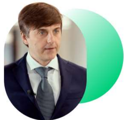
Кравцов Сергей Сергеевич,

Она дает молодежи возможность увидеть свое место в будущем страны, внести личный вклад в развитие науки, промышленности, экономики. Именно поэтому работа по профориентации проводится в школах в рамках внеурочной деятельности, охватывает всю систему дополнительного образования. Очень ценно, что сегодня к ней активно присоединяется профессиональное сообщество, те, кто напрямую взаимодействует с нашими замечательными и талантливыми ребятами.