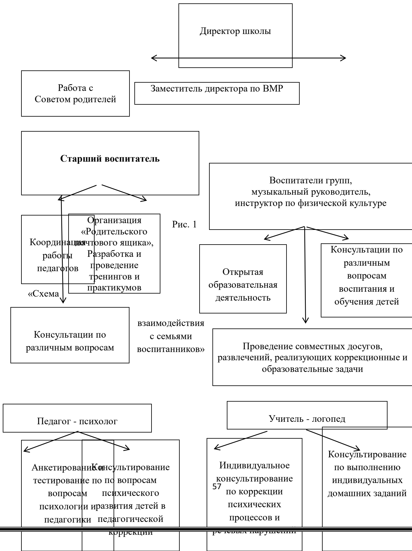
Схема взаимодействия с семьями воспитанников